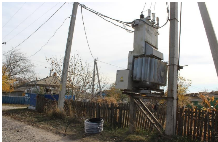
Programul Diaspora Acasă Reușește DAR 1+3, implementat la Mihăileni, Rîșcani